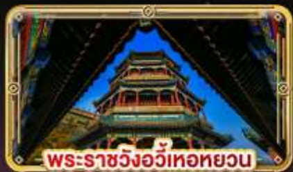
พระราชวังอวิหะทยวน