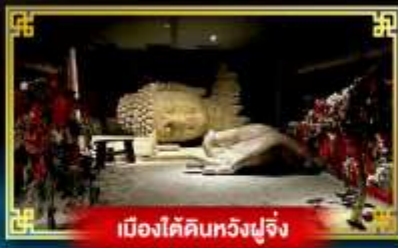
เมืองใต้ดินหวงฝูจิ่ง