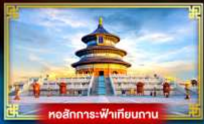
หอสักการะฟ้าเทียนถาน