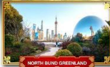
NORTH BUND GREENLAND