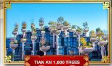
TIEN AN 1,000 TREES