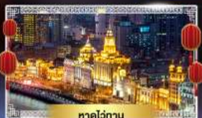
หาดไว่ถาน