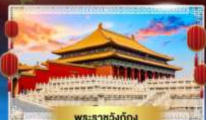
พระราชวังทงกิง