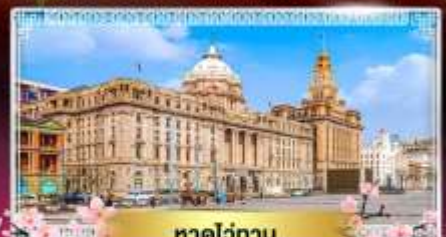
หาดไถ่ทวน

“ชมดอกซากุระนลิบาน ณ แดนมังกร” ล่องเรือทะเลสาบตะวันตก ไข่มุกแห่งหางโจว