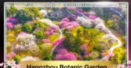
Hangzhou Botanic Garden