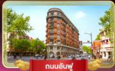
ถนนอันฟู่