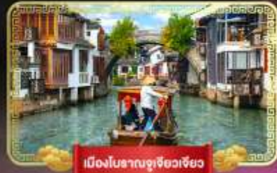
เมืองโบราณซูโจวเซียว