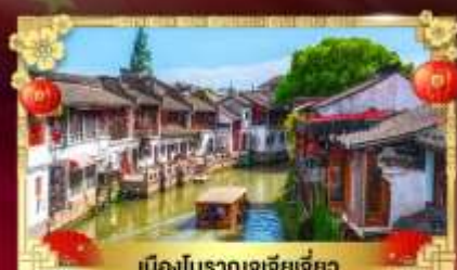
เมืองโบราณซูเจียเจียว

สนุกเต็มพิกัด “สวนสนุกดิสนีย์แลนด์เซี่ยงไฮ้”