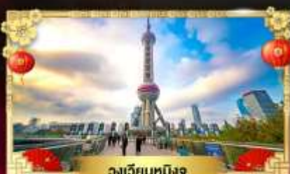
วงเวียนหมิงจู่