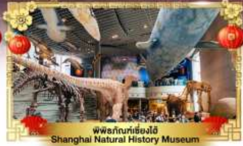
พิพิธภัณฑ์เซี่ยงไฮ้ Shanghai Natural History Museum

เดินทางโดย : สายการบินโซน่าอีสเทิร์นแอร์ไลน์