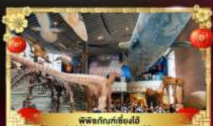
พิพิธภัณฑ์เซี่ยงไฮ้ Shanghai Natural History Museum