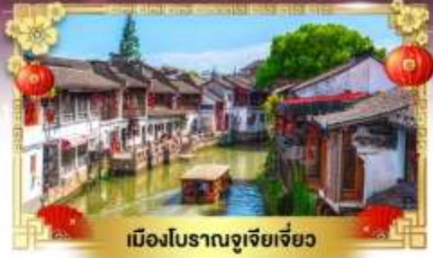
เมืองโบราณจูเจียเจียว