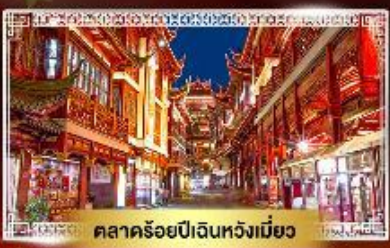
ตลาดร้อยปีเงินหวังเหมียว

📅 เดินทาง : 10-15 เม.ย. | 12-17 เม.ย. 68