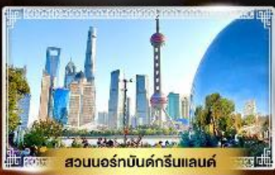
สวนนอร์มัลบันด์กรีนแลนด์