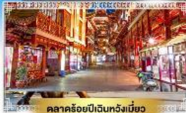
ตลาดร้อยปีฉินหวงเหมียว