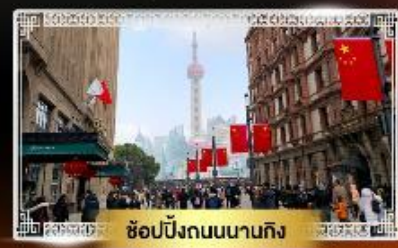
ช้อปปิ้งถนนนานกิง