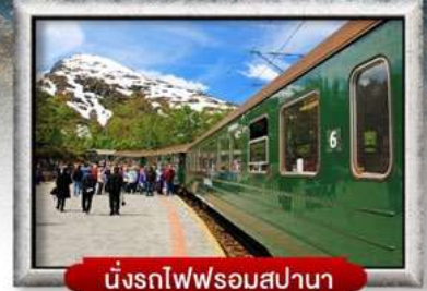
นั่งรถไฟชมสเปนา

พิเศษ! พักบนเรือสำราญ แบบ Window Room 2 คืน, พักบ้านแซนต้าคลอส