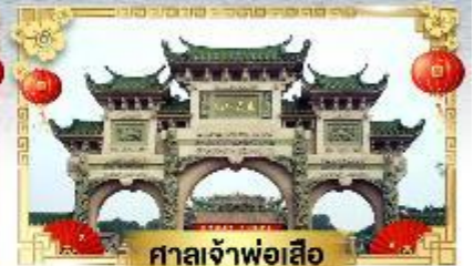
ศาลเจ้าพ่อเสือ