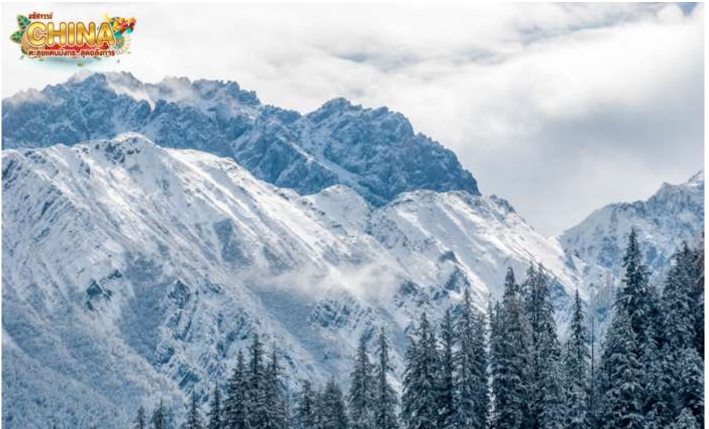
สถานที่ท่องเที่ยวที่ภายในอุทยานแห่งชาติจิวจ้ายโกว

นำท่านเดินทางสู่ อุทยานแห่งชาติจิวจ้ายโกว (โดยรถของอุทยาน) เพื่อชมมรดกโลกอุทยานแห่งชาติธารสวรรค์ “จิวจ้ายโกว” หนึ่งในมรดกโลกทางธรรมชาติของประเทศจีนที่ขึ้นชื่อเรื่องความสวยงามของภูเขา ลำธาร น้ำตก และทะเลสาบ ตั้งอยู่สูงกว่าระดับน้ำทะเลถึง 2,500 เมตร ภายในอาณาบริเวณอุทยานจิวจ้ายโกวประกอบด้วยภูเขาและหุบเขาอันสลับซับซ้อน เนื่องจากพื้นที่ส่วนใหญ่มีระดับพื้นดินที่ลาดชันจึงทำให้เกิดแอ่งน้ำน้อยใหญ่มากมาย ทั้งกลุ่มน้ำตกใหญ่น้อยและแม่น้ำ ซึ่งไหลมาจากหุบเขารวม 5 สาย ในยามฤดูใบไม้เปลี่ยนสีนั้น สีสนของทะเลสาบแห่งนี้จะเต็มไปด้วย สีแดง สีส้ม สีเหลือง ของใบไม้ที่ปลิดปลิวร่วงหล่นลงไปบนทะเลสาบ หากเป็นช่วงฤดูหนาวก็จะถูกปกคลุมไปด้วยหิมะให้บรรยากาศที่สวยงามไปในอีกรูปแบบหนึ่ง จนได้รับฉายาว่า “ดินแดนแห่งเทพนิยาย” (หมายเหตุ: ราคารวมรถอุทยานแล้ว (รถเวียน) หากต้องการเหมารถแบบส่วนตัวทั้งกรุ๊ป ต้องชำระเพิ่มกับทางไกด์ท้องถิ่นหรือหัวหน้าทัวร์)