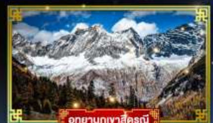
อุทยานภูเขาสี่ฤดู