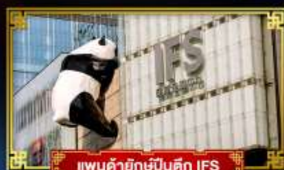
แพนด้ายักษ์ปิงตึก IFS