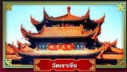
วัดเจเจีย