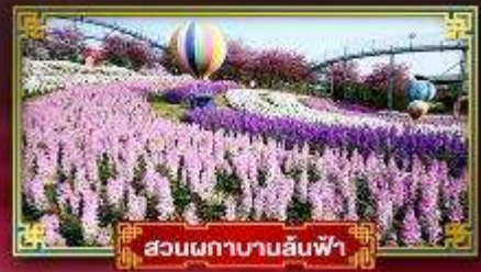
สวนผักบานสีฟ้า

อุทยานสัตว์กึ่งป่าหิมะการ์เซียคำกู่ปิงชวน