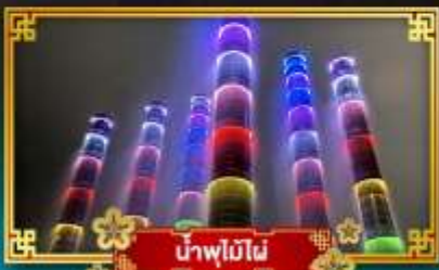
น้ำพุไม๊ผៃ