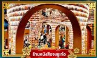
ร้านหนังสือชว่นก้อ