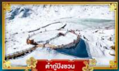
คำกู่ปิงชว่น

สัมผัสความหนาว เที่ยวจัดเต็ม “4 อุทยานสวรรค์”