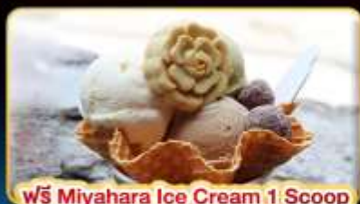
ฟรี Miyahara Ice Cream 1 Scoop

"ขอความรักวัดหลงซาน" ปล่อยโคมลอยเส้นทางรถไฟผิงซี