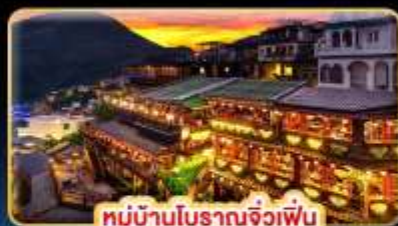
หมู่บ้านโบราณจงเฉิงเฟิน