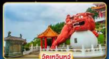
วัดเหวินเหว่