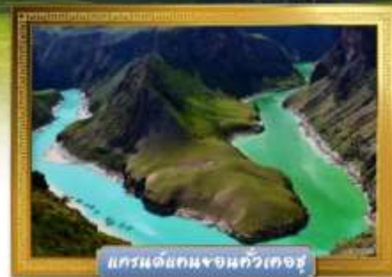
แกรนด์แคนยอนจันทูเคอซู

เดินทางโดย : สายการบินโซนาเซาเทิร์นแอร์ไลน์