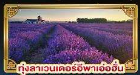
ทุ่งลาเวนเดอร์อิฟาเอ้อฮัน