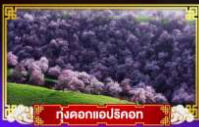
ทุ่งดอกแอปริคอต