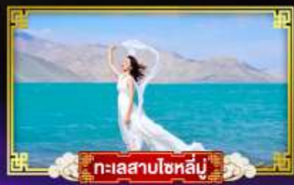
ทะเลสาบโซหลัน