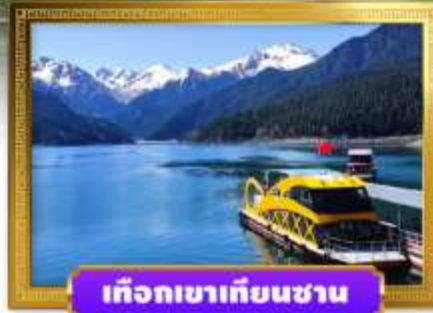
เทือกเขาเทียนชาน