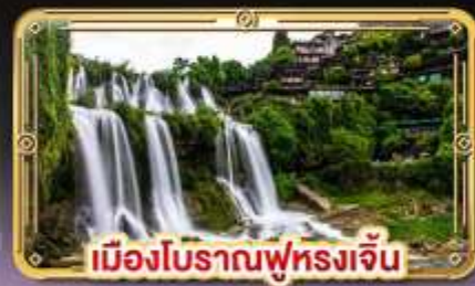
เมืองโบราณฟูหลงเจิน