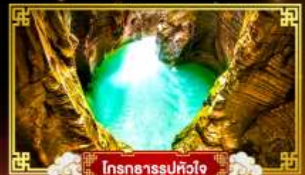
โตรกธารรูปหัวใจ