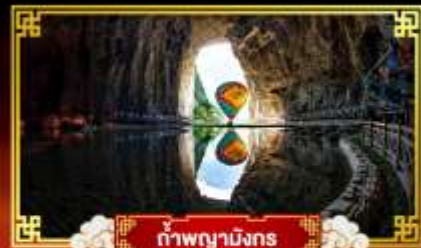
ถ้ำผานางมรกต