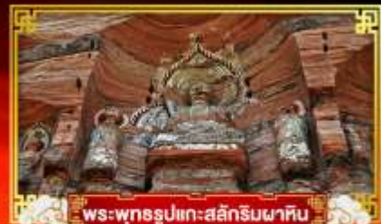
พระพุทธรูปแกะสลักหินผาศิน