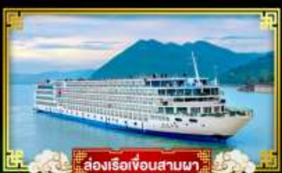
ล่องเรือเขื่อนสามผา