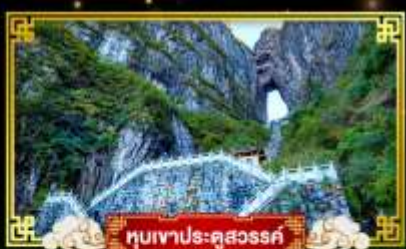
ทิวเขาประตูสวรรค์