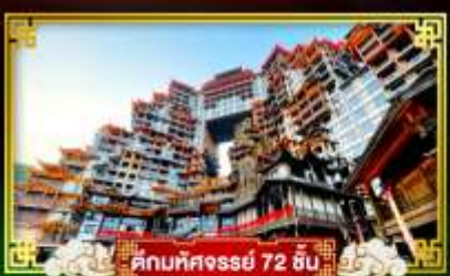
คกทศจรรย 72 ชั้น