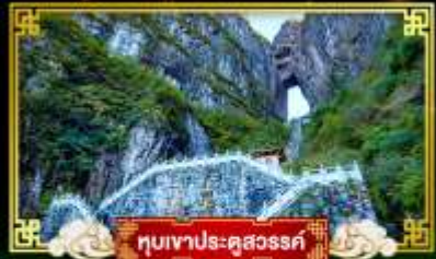
หุบเขาประตูสวรรค์