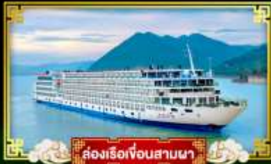
ล่องเรือเจ็อนสามผา