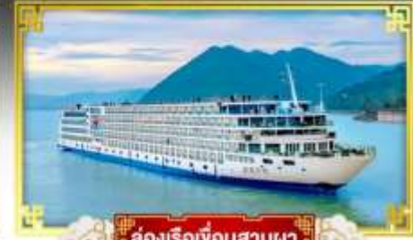
ล่องเรือเขื่อนสามผา