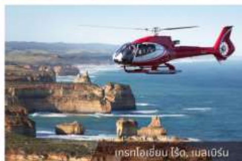
เที่ยวไฮลิคอปเตอร์, เมลเบิร์น