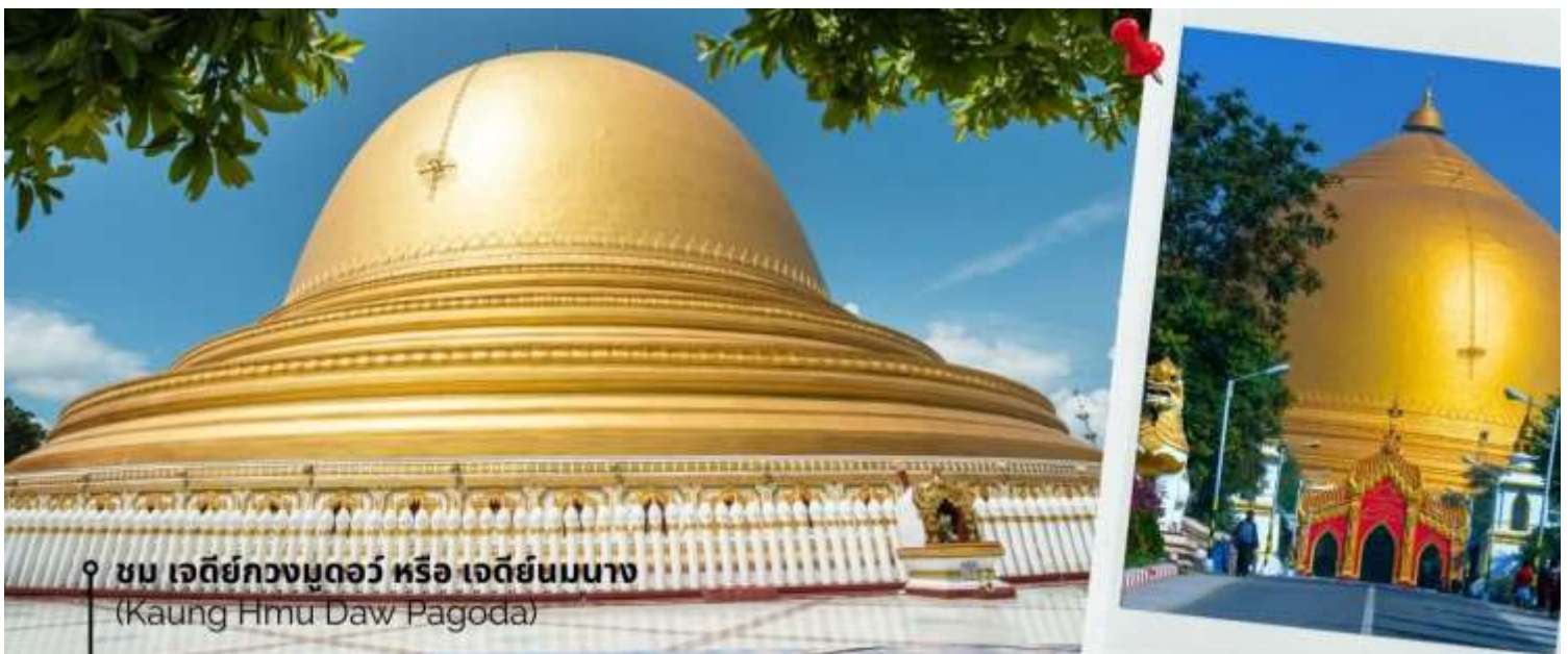
ชม เจดีย์กวงมุดอว์ หรือ เจดีย์นมนาง (Kaung Hmu Daw Pagoda)

นำท่านชม เจดีย์กวงมุดอว์ หรือ เจดีย์นมนาง (Kaung Hmu Daw Pagoda) เป็นเจดีย์พุทธขนาดใหญ่ ตั้งอยู่เขตชานเมืองทางตะวันตกเฉียงเหนือของชะไก้ โดยจำลองตามสวัณณมาลีมหาเจดีย์ ในประเทศศรีลังกา ฐานชั้นล่างสุดของเจดีย์ประดับด้วยนระและเทวดา 120 องค์ ล้อมรอบด้วยโคมหิน 802 ต้น ซึ่งแกะสลักพร้อมจารึกพุทธประวัติสามภาษาได้แก่ พม่า, มอญ และไทใหญ่ เป็นตัวแทนของสามภูมิภาคหลักสมัยอาณาจักรตองอูยุคฟื้นฟู โดมของเจดีย์ได้รับการทาสีขาวอย่างต่อเนื่อง เพื่อแสดงถึง