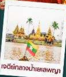
เจดีย์กลางน้ำเยเลพญา