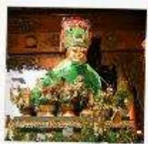
ขอพรแม่ยักษ์