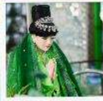
เทพกระซิบ