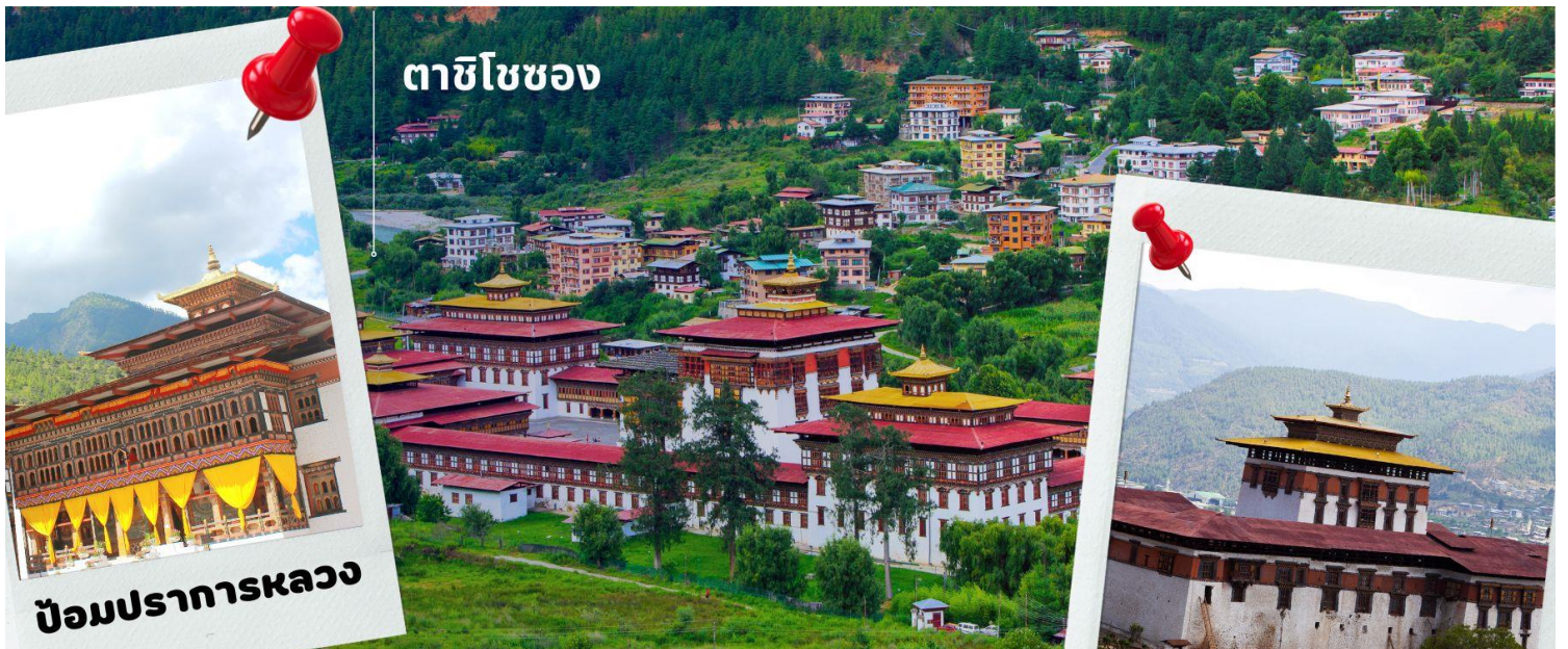
ตาซีโซซง

นำท่านเดินทางสู่ เมืองทิมพู เมืองหลวงของประเทศภูฏานตั้งแต่ปี ค.ศ. 1961 ใช้เวลาการเดินทางประมาณ 1 ชม. นำท่านเดินทางเข้าชม ตาซีโซซง มหาปราการแห่งศานาและวิหารหลวงแห่งเมืองทิมพู (วันธรรมดาเปิดหลัง16.30น. / เสาร์-อาทิตย์ เปิดทั้งวัน) ตาซีโซซง หมายถึง ป้อมแห่งศานาอันเป็นมงคล สร้างในสมัยศตวรรษที่ 12 โดย ท่านซังตรง งามวัง นัมเกล ปัจจุบันเป็นสถานที่ทำงานของพระมหากษัตริย์ สถานที่ทำการของกระทรวงต่างๆ และวัด รวมทั้งเป็นพระราชวังฤดูร้อนของพระสังฆราช และบริเวณอันใกล้ท่านจะได้เห็นวังที่ประทับส่วนพระองค์ของพระราชอาธิบดี จิกมี ด้าย