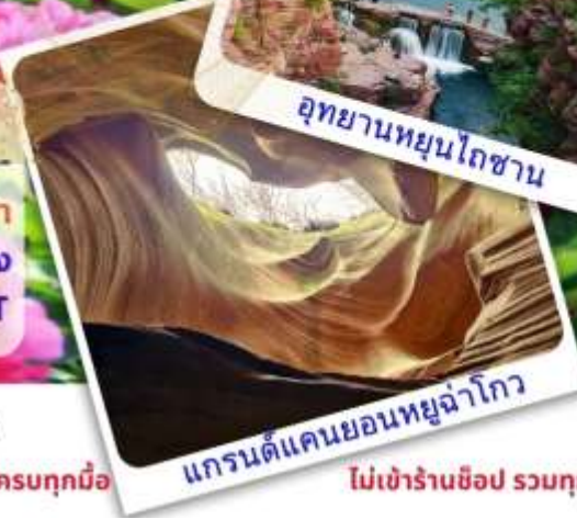
แกรนด์แคนยอนหยูฉ่าโกว