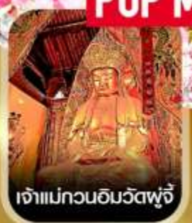
เจ้าแม่กวนอิมวัดฟูจี

✈️ คอนเฟิร์มออกเดินทาง ✈️ ทุกพีเรียด 2 ท่านขึ้นไป