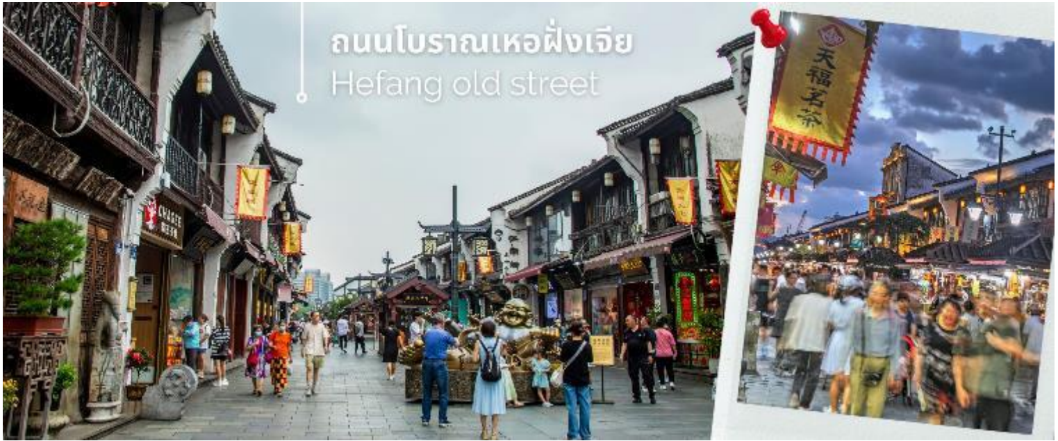
ถนนโบราณเหอฝิงเจีย Hefang old street

จากนั้นนำท่านเดินทางชม ถนนโบราณเหอฝิงเจีย เป็นส่วนหนึ่งของย่านคึกคักโบราณ "ชิงเหอฟาง" ในเขตเมืองเก่าของ หังโจว เมืองเอกมณฑลเจ้อเจียง บริเวณตีนเขาอู่ซาน ถนนมีความยาว 1,800 เมตร กว้าง 13-32 เมตร ในอดีตบริเวณสี่ มุมถนนที่เป็นจุดตัดของถนนเหอฟางเจียกับถนนจงซานจงลู่ ถือเป็นหัวใจของย่าน ที่นี่เป็นถนนคนเดิน นักท่องเที่ยวจะได้ พบกับประวัติศาสตร์และวัฒนธรรมอันเก่าแก่ของหางโจวได้อย่างดี บ้านเรือนทั้งสองข้างทางที่สร้างขึ้นใหม่ล้วนสร้างจาก