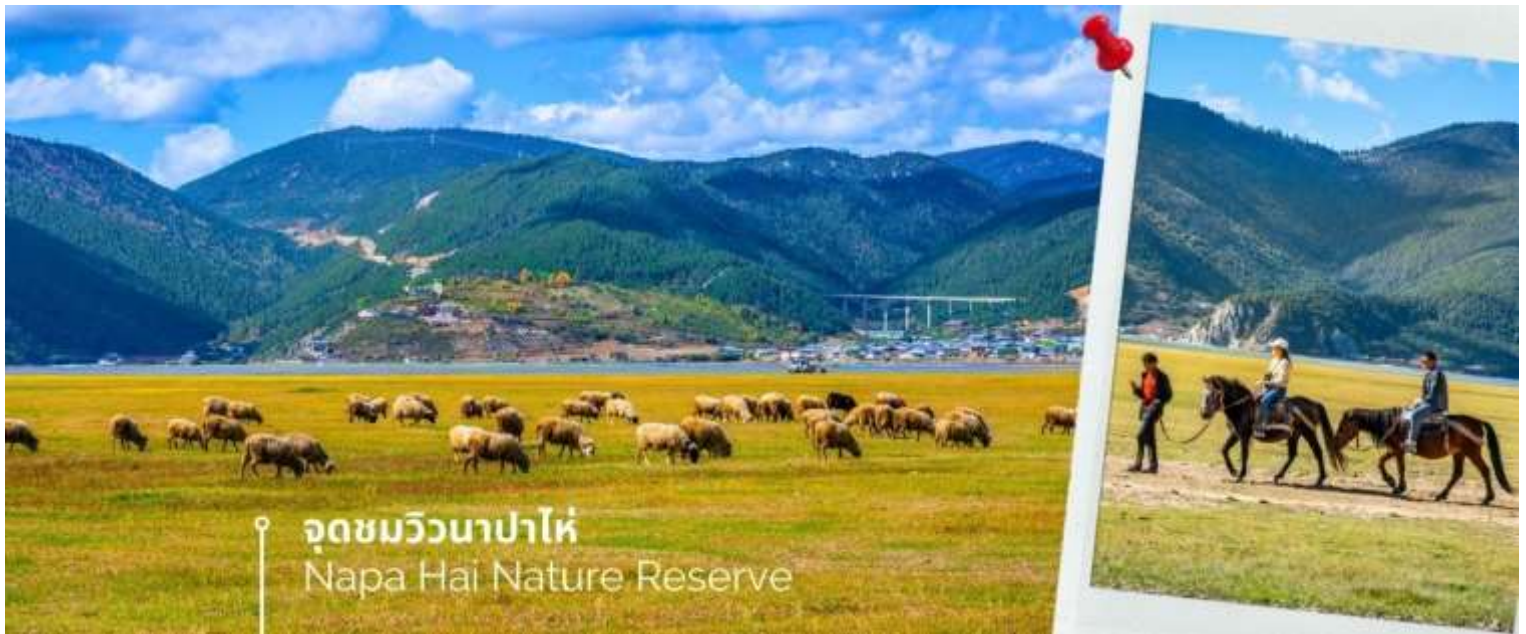
จุดชมวิวนาปาไห่ Napa Hai Nature Reserve

จากนั้นเดินทางไปยัง จุดชมวิวนาปาไห่ พื้นที่ราบสูง ที่สูงขึ้นไปมากถึง 3,266 เมตรจากระดับน้ำทะเล ครอบคลุมพื้นที่ 660 กิโลเมตร ห้อมล้อมไปด้วยเทือกเขาทั้ง 3 ด้านและมีลำธาร 2 สายไหลมารวมกัน ความอลังการของวิวทิวทัศน์ที่ทำให้คนต่างก็อยากขึ้นไปชื่นชมที่สูงขนาดนั้น ก็เพราะความสวยงามที่เปลี่ยนไปตามแต่ฤดูกาล สวยงามทั้งปี จะเป็นช่วงที่ทุ่งหญ้าเขียวขจีและดอกไม้ขึ้นบานสะพรั่ง ช่วงฤดูหนาวเทือกเขาและทะเลสาบชาวโพลน บรรยากาศฤดูร้อนจะสดใส ท้องฟ้ากระจ่าง และจะพบเหล่าฝูงม้า แกะและจามรีที่ลงมาทะเลสาบที่เป็นแหล่งน้ำและอาหาร