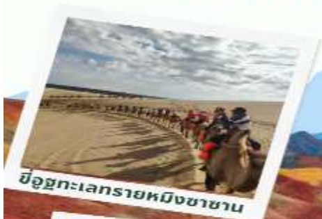
ขบวนคาราวานอูฐ