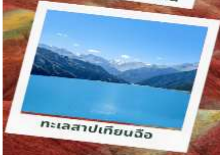
ทะเลสาบเทียนฉือ