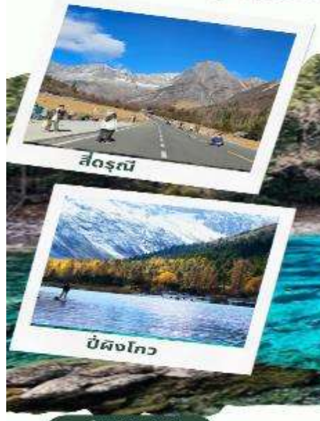
สี่ดรุณี