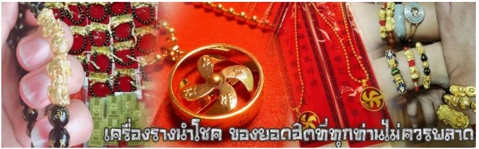
เครื่องรางนำโชค ของยอดฮิตที่ทุกท่านไม่ควรพลาด