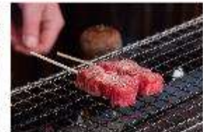
รูปประทานอาหารกลางวัน ณ ภัตตาคาร