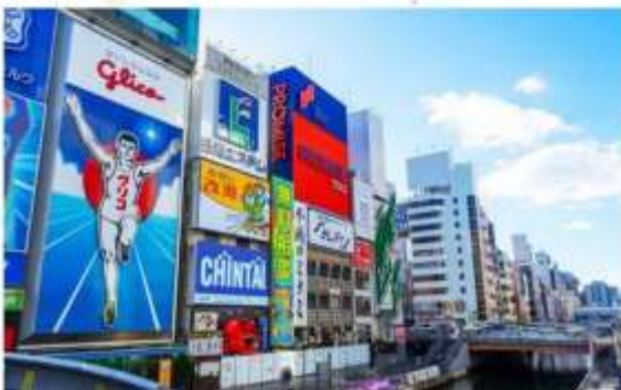
รูปภาพประกอบอีพีการโฆษณาเท่านั้น