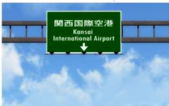
07 รูปภาพประกอบลิขสิทธิ์การออกแบบท่านั้น