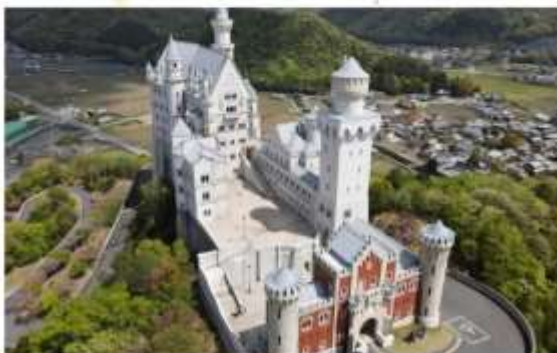
รูปภาพประกอบใช้เพื่อการโฆษณาเท่านั้น