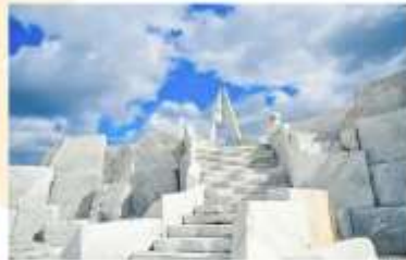
รับประทานอาหารกลางวัน ณ วัดคาคารุ