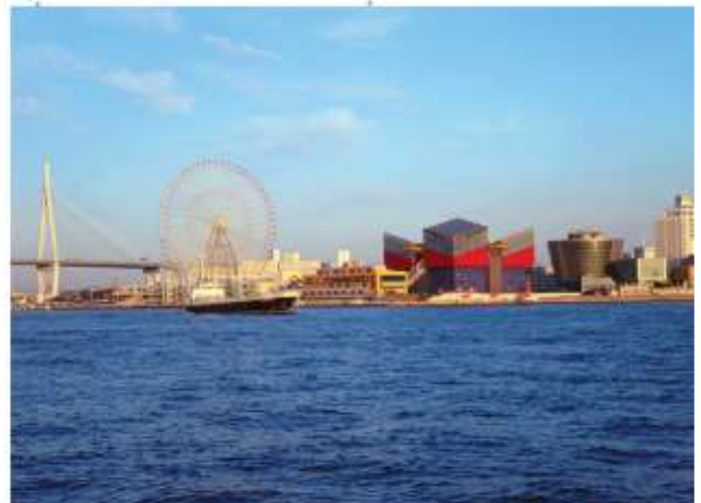
VISIT TEMPOZAN MARKET PLACE