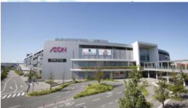
SHOPPING AT AEON MALL RINKU SENNAN/TSUKIGESHO FACTORY