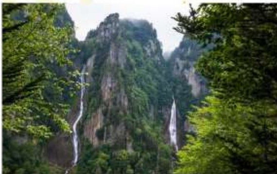
RYUSEI & GINGA WATERFALLS