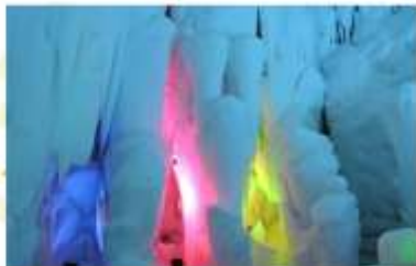
KAMIKAWA ICE PAVILLION