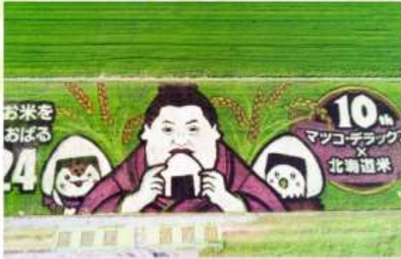
TANBO ART RICE FIELDS

ดื่มด่ำกับ "ศิลปะบนผืนนาข้าว" หนึ่งในจุดหมายสุดสร้างสรรค์ของออกโทโด! ที่มีใช้พันธุ์ข้าวหลากหลายสีสร้างสรรค์เป็นภาพศิลปะขนาดใหญ่บนผืนนา เปลี่ยนแปลงไปตามธีมในแต่ละปี ให้คุณได้สัมผัสความงามที่ผสมผสานระหว่างธรรมชาติและวัฒนธรรมญี่ปุ่นอย่างลงตัว