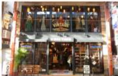
SHOPPING AT TANUKIKOJI STREET