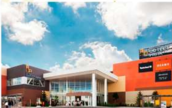
SHOPPING AT KITA HIROSHIMA OUTLET

“มิดชูย เอาท์เล็ต พาร์ค ซัปโปโร คิตะฮิโรชิม่า” เป็นเอาท์เล็ตขนาดใหญ่ที่สุดในภูมิภาคฮอกไกโด ตั้งอยู่ในเมืองคิตะฮิโรชิม่า ที่มีเป็นแหล่งช้อปปิ้งยอดนิยมนสำหรับนักท่องเที่ยวและชาวญี่ปุ่น ด้วยร้านค้ากว่า 180 แบรนด์ชั้นนำ ทั้งในและต่างประเทศ ไม่ว่าจะเป็นสินค้าแฟชั่น เสื้อผ้า รองเท้า กระเป๋า เครื่องสำอาง และอุปกรณ์กีฬาจากแบรนด์ดัง ในราคาสุดพิเศษ ทำให้มีสินค้าหลากหลายคอนโจทย์ทุกความต้องการ