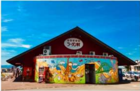
RAMEN VILLAGE ASAHIKAWA