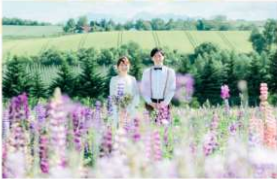
FLOWER LAND KAMIFURANO