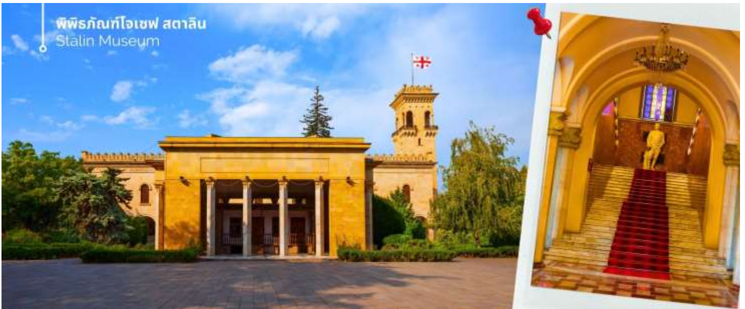
พิพิธภัณฑ์โจเซฟ สตาลิน Stalin Museum

ออกเดินทางต่อไปยังเมืองกอรี (ใช้เวลาเดินทางประมาณ 1 ชั่วโมง 20 นาที) นำท่านเที่ยวชม พิพิธภัณฑ์โจเซฟ สตาลิน (Stalin Museum) ซึ่งที่เมืองนี้เป็นบ้านเกิดของโจเซฟ สตาลิน อดีตผู้นำสูงสุดของสหภาพโซเวียต สตาลินถูกยกย่องเป็นวีรบุรุษที่นำพาสหภาพโซเวียตให้รุ่งเรือง แต่ในขณะเดียวกันก็เป็นที่รู้จักในด้านการกดขี่ข่มเหงและการฆ่าล้างเผ่าพันธุ์ พิพิธภัณฑ์แห่งนี้จึงเป็นแหล่งเรียนรู้เกี่ยวกับชีวิตและผลงานของสตาลิน รวมถึงผลกระทบที่เขามีต่อ