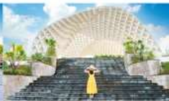
สวนเอเปค