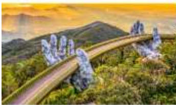
บานาฮิลล์