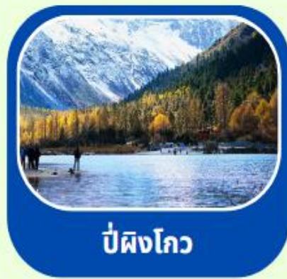
ป่าผิงโกว

เดินทาง : 17-22 พค // 20-25 มิย 8-13 กค 2568