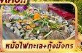
หม้อไฟทะเล+กุ้งมังกร