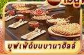
บุฟเฟ่ต์บนบานาอิลล์