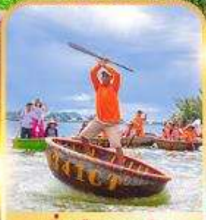
นั่งเรือกระด้ง