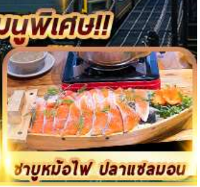
ซาบูหมือฟ ปลาแซลมอน