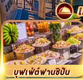
บุฟเฟต์ฟานชีปัน