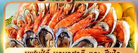
บุฟเฟ่ต์ นานาชาติ และ ซิวัด