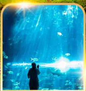
อควาเรียม