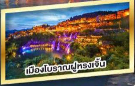
เมืองโบราณผู้ทรงเจิน