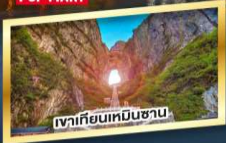
เขาเทียนเหมินซาน