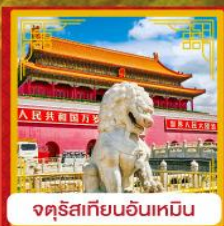
จตุรัสเทียนอันเหมิน