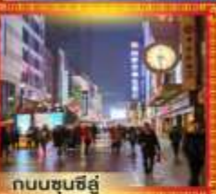
ถนนชุนชี่ฮู่