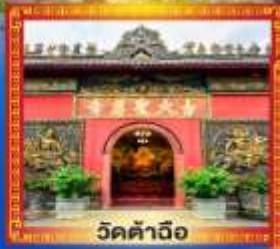
วัดคำฉื่อ