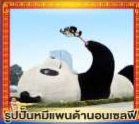
รูปปั้นหมีแพนด้าอนเซลฟ์