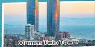
Xiamen Twin Tower