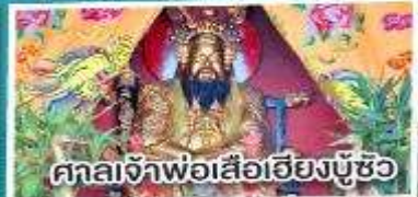
ศาลเจ้าพ่อเสือเอียงบู๊ซิว