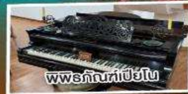
พิพิธภัณฑ์เปียโน

พัก 4 ดาว เมนูพิเศษ!!! เปิดปิกกึ่ง อาหารแต่จิว 18 อย่าง