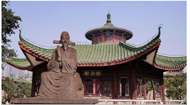
https://www.chinadiscovery.com/hainan/haikou/things-to-do.html Hairui Tomb © 海口市旅行社协会/ishar.ifeng

ค.ศ. 1587) เจ้าหน้าทีผู้ซื่อสัตย์และไม่ทุจริต สุสานแห่งนี้สร้างขึ้นครั้งแรกในปี ค.ศ. 1589 ในสมัยราชวงศ์หมิง (ค.ศ. 1368-1644) โครงสร้างบางส่วนในสวนสุสานยังคงสภาพสมบูรณ์ ด้วยพื้นที่กว่า 4,000 ตารางเมตร การจัดวางสุสานได้รับการออกแบบตามระดับของตำแหน่งทางการในสมัยนั้น สถาปัตยกรรมและอาคารในสุสานไห่รุ่ย มีความเคร่งขรึมและดั้งเดิม มีซุ้มประตูหินสูงตระหง่านที่ประตูหน้า มีจารึกแนวอนว่า "ความชอบธรรมของกวางตุ้งตะวันออก (粤东正气)" ทางเดินยาวกว่า 100 เมตร ที่นำไปสู่สุสาน ปูด้วยหินแกรนิต มีการแกะสลักหิน เช่น รูปคนหิน แกะหิน ม้าหิน สิงโตหิน เต่าหินที่ยืนอยู่ทั้งสองข้าง ปัจจุบันสุสานแห่งนี้ได้รับการจัดอันดับให้เป็นมรดกทางวัฒนธรรมที่สำคัญของมณฑลไห่หล่า