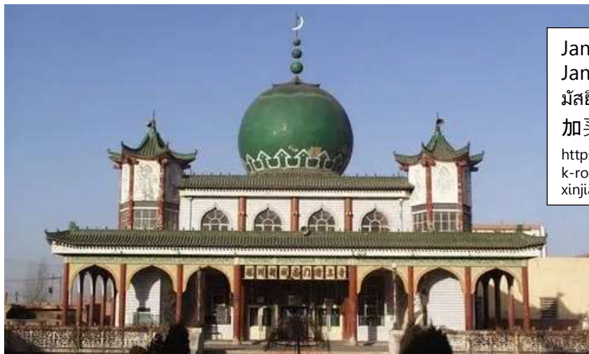
Jami Mosque Jama Mosque มัสยิดใหญ่จามา “ชิงเจินฉือ” 加买清真寺