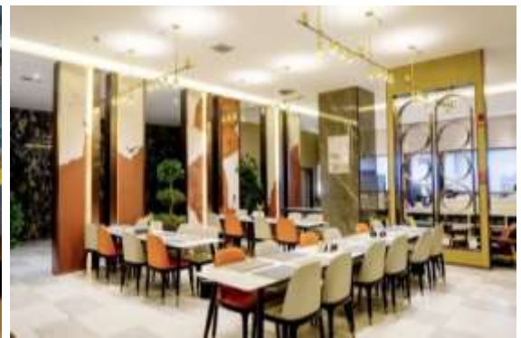
หรือ SHACHE: JI HOTEL (Gulebage Road Hotel) หรือเทียบเท่า เปิดบริการ: 2021