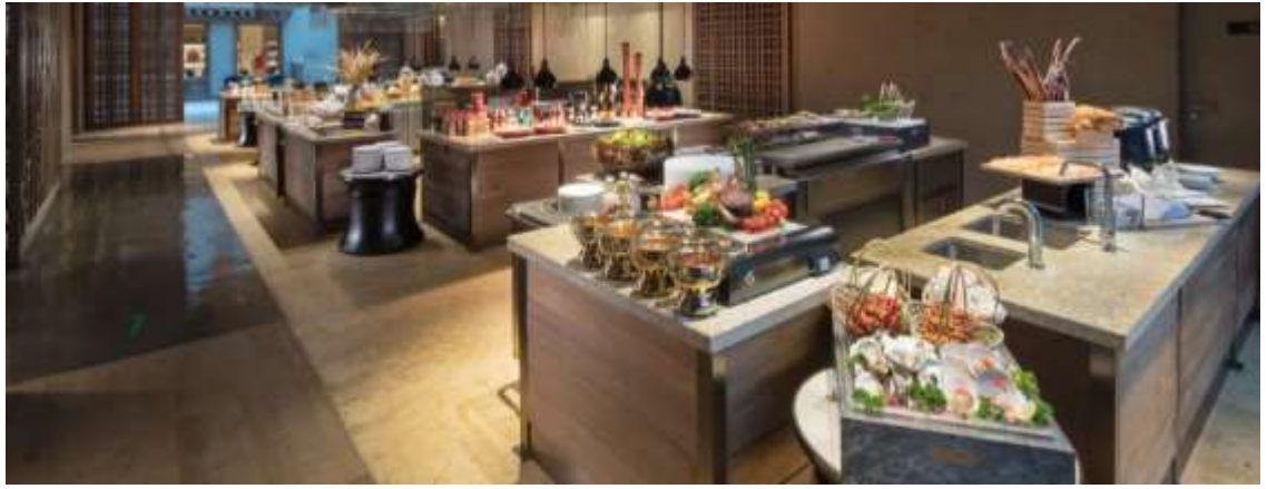
ที่พัก Hilton Jiuzhaigou Resort ระดับ 5 ดาว หรือเทียบเท่า