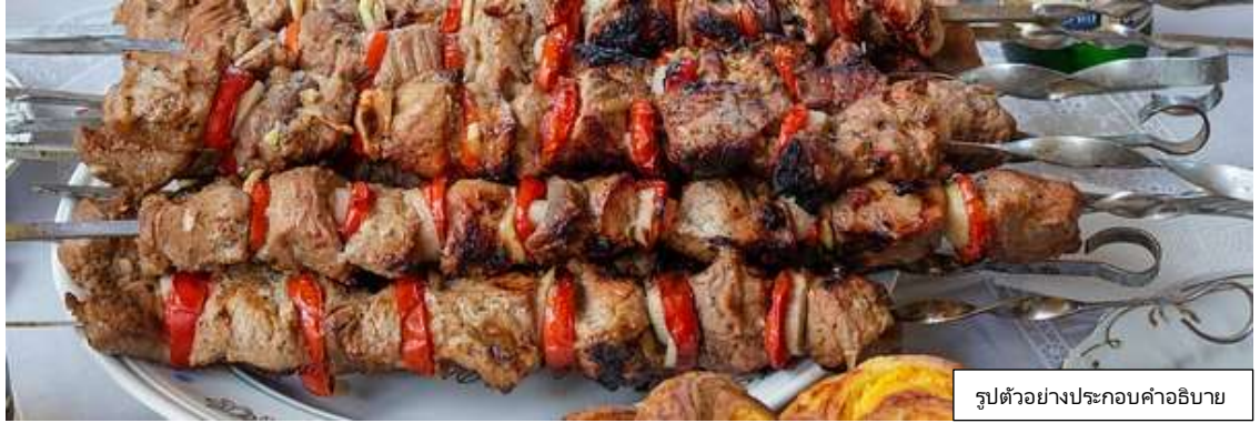
รูปตัวอย่างประกอบคำอธิบาย

อาหารค่ำ พิเศษ เมนูจามรียงเครื่องเทศ 1 ท่าน / 1 ไม้ใหญ่