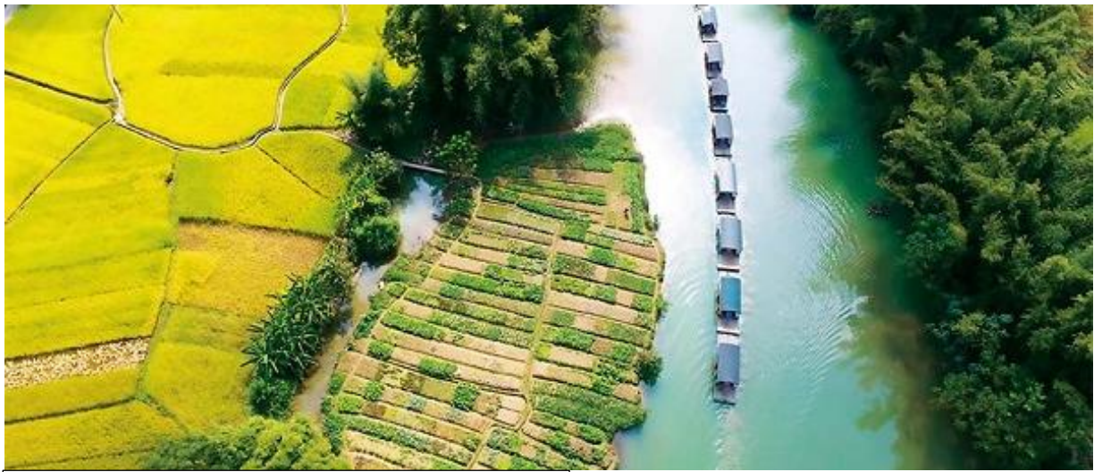
Bamboo rafts line up on the river in the Mingshi tourist resort. [Photo /People's Daily]

รถบัสนำท่านไปส่งที่ท่าแพต้นน้ำ เพื่อให้ท่าน ลงแพไม้ไผ่หมิงชื่อเถียนเหยียน ชมทัศนียภาพสองฝั่งลำน้ำ และบรรยากาศอันสดชื่นที่มีภูเขาที่เป็นฉากหลัง ที่เรียกว่า "วิวภาพเขียนร้อยสี" วิวนี้โด่งดังเพราะ มีซีรีส์ทีวี "ฮวาเซียนกุ" มาถ่ายทำที่นี่ ขณะลงแพท่านจะได้พบเห็นวิถีชีวิตของชาวฉางชนบท ที่ออกมาทำกิจกรรมประจำวัน เมืองฉิงซีมีอากาศเย็นสบายและมีทัศนียภาพทางธรรมชาติสวยงามคล้ายเมืองกุ้ยหลิน